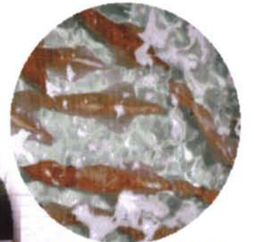
イカが呼んでるよ!

場所：佐賀県東松浦郡鎮西町串 宿泊料：一般………1泊8,000円より ビジネス（長期滞在）1泊4,800円より 消費税別途 ●シングル(和室)14室 ●ツイン(和室)3室